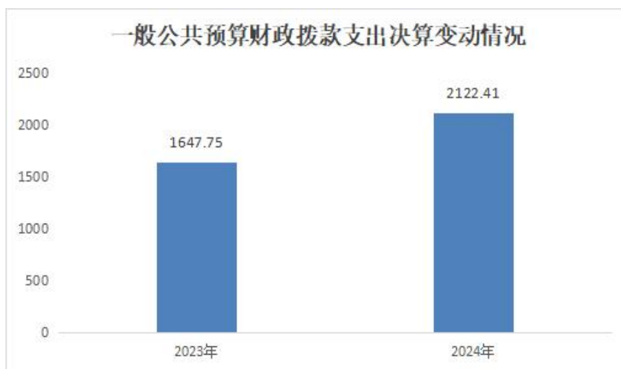
（图 5：一般公共预算财政拨款支出决算变动情况）

（二）一般公共预算财政拨款支出决算结构情况。 2024 年度一般公共预算财政拨款支出 2122.41 万元，主要用于以下方面：科学技术支出 4.54 万元，占 0.21%；社会保障和就业支出 302.59 万元，占 14.26%；卫生健康支出 1628.62 万元，占 76.73%；住房保障支出 186.66 万元，占 8.8%。