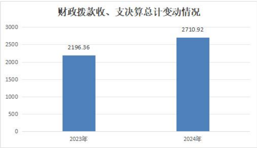
(图 4：财政拨款收、支决算总计变动情况)

2024 年度财政拨款收入、支出总计均为 2710.92 万元。与 2023 年度相比，财政拨款收入总计、支出总计各增加 514.56 万元，上升 23.43%。主要变动原因是 2024 年支付 2023 年人员经费较多，如住房公积金、社保金等。