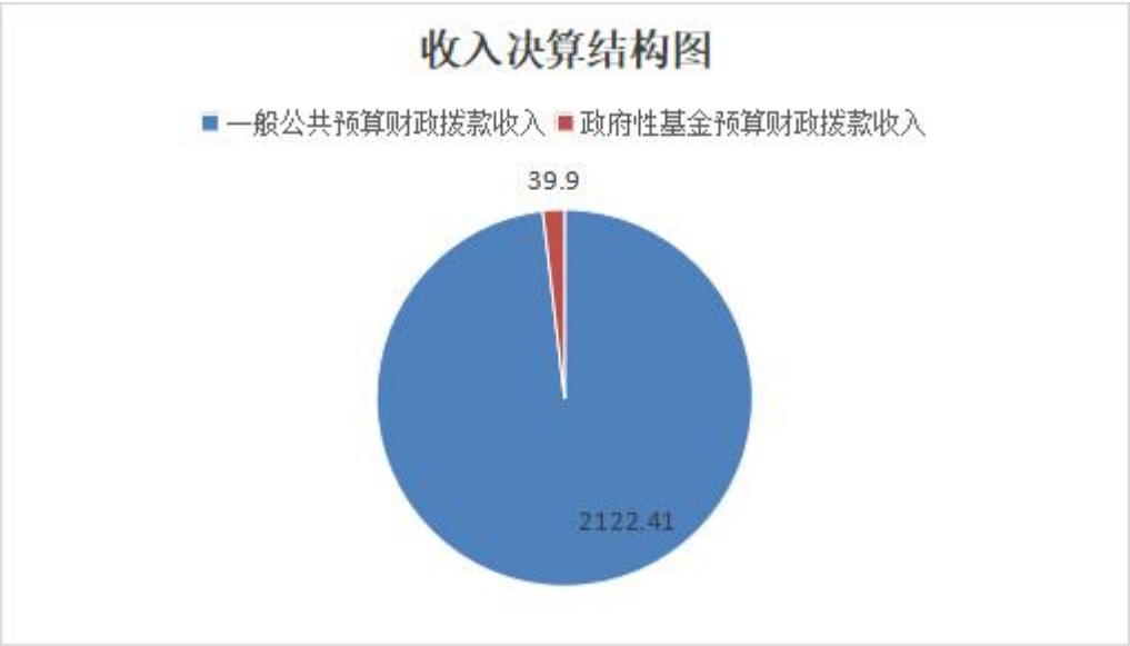
(图 2：收入决算结构图)

2024 年度本年支出合计 2162.31 万元，其中：基本支出 2058.56 万元，占 95.2%；项目支出 103.75 万元，占 4.8%。