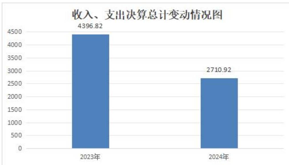
(图 1：收入、支出决算总计变动情况图)

2024 年度收入、支出总计均为 2710.92 万元。与 2023 年度相比，收入、支出总计各减少 1685.9 万元，下降 38.34%。主要变动原因是我中心于 2023 年 7 月开始改变疫苗账务核算方式，停止以事业支出和事业收入的方式核算疫苗买卖，收到疫苗时借记库存物品，贷记疫苗企业应付账款，销售疫苗时借记银行存款，贷记库存物品，实际支付疫苗企业时借记应付账款贷记银行存款，故 2023 年上半年存在疫苗收入计入了事业收入，2024 年收入支出小于 2023 年。