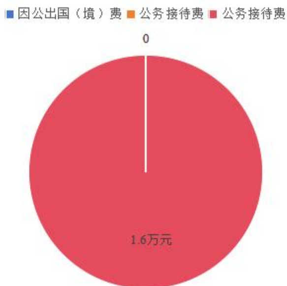
（图 7：“三公”经费财政拨款支出结构）（饼状图）