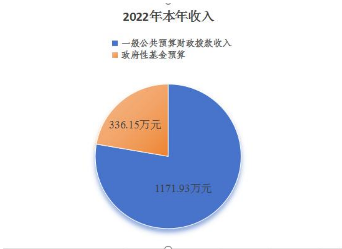
(图 2: 收入决算结构图) (饼状图)