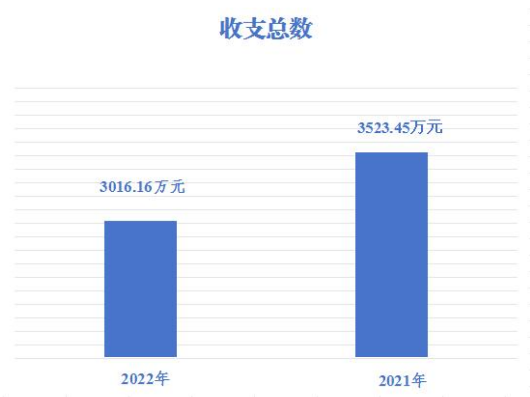
(图 1: 收、支决算总计变动情况图) (柱状图)

2022 年财政拨款收、支总计 3016.16 万元。与 2021 年相比，财政拨款收、支总计减少 507.29 万元，减少 16.82%。主要变动原因是厉行节约，控制经费。