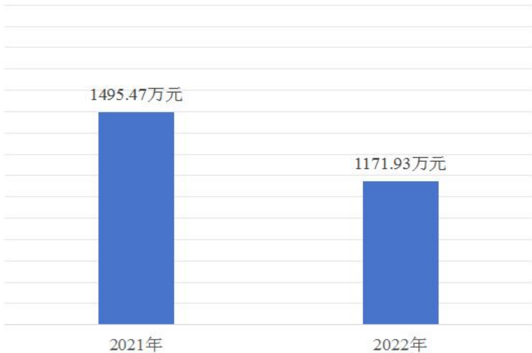
（图 5：一般公共预算财政拨款支出决算变动情况）（柱状图）